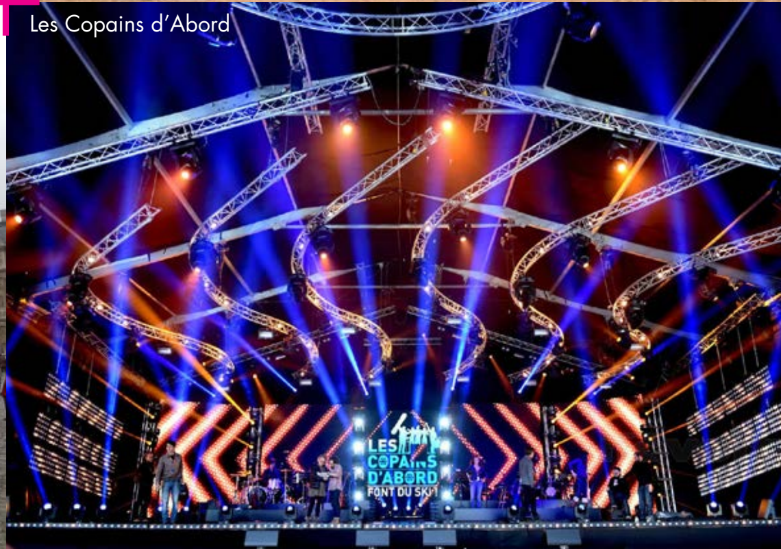
Les Copains d'Abord