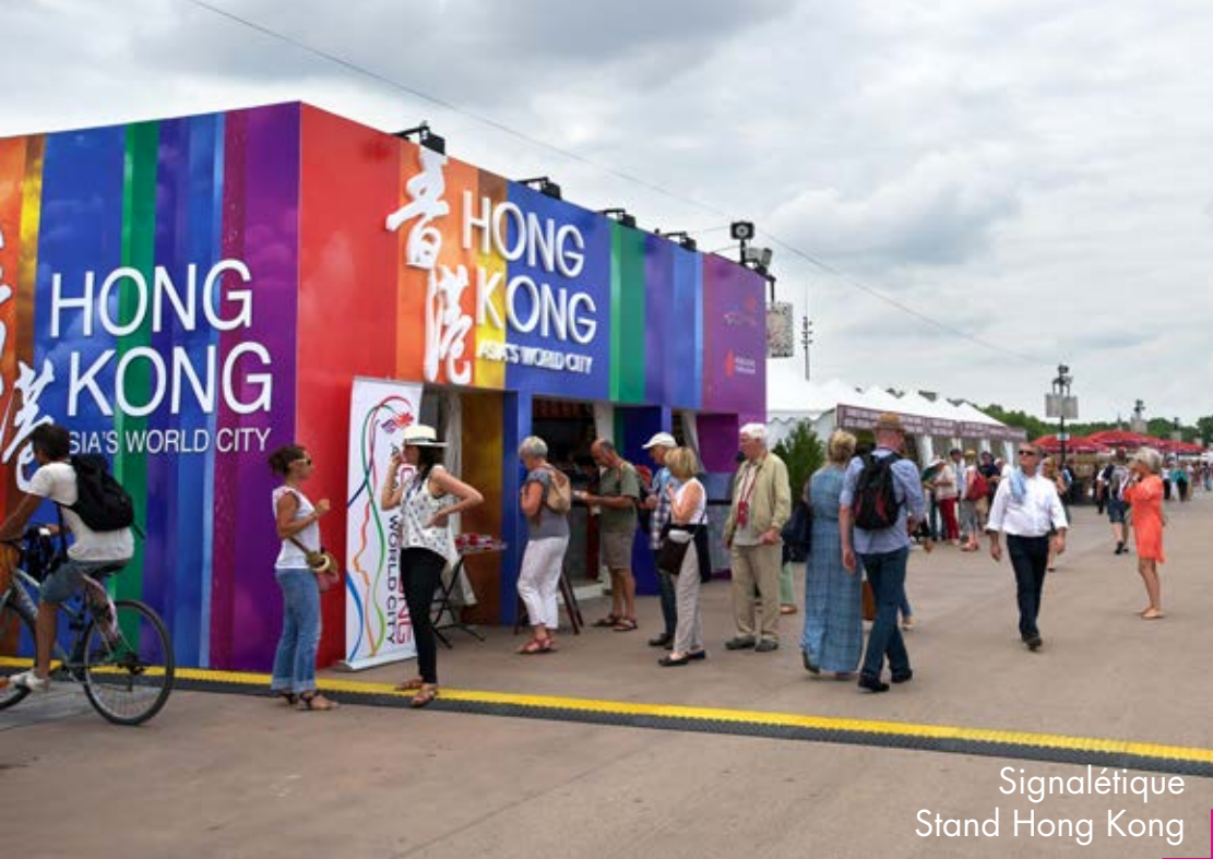
Signalétique Stand Hong Kong