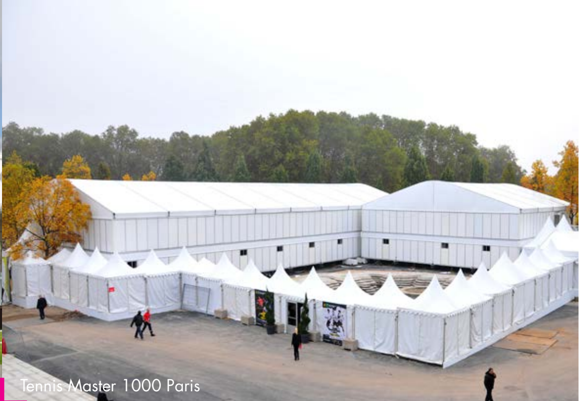
Tennis Master 1000 Paris