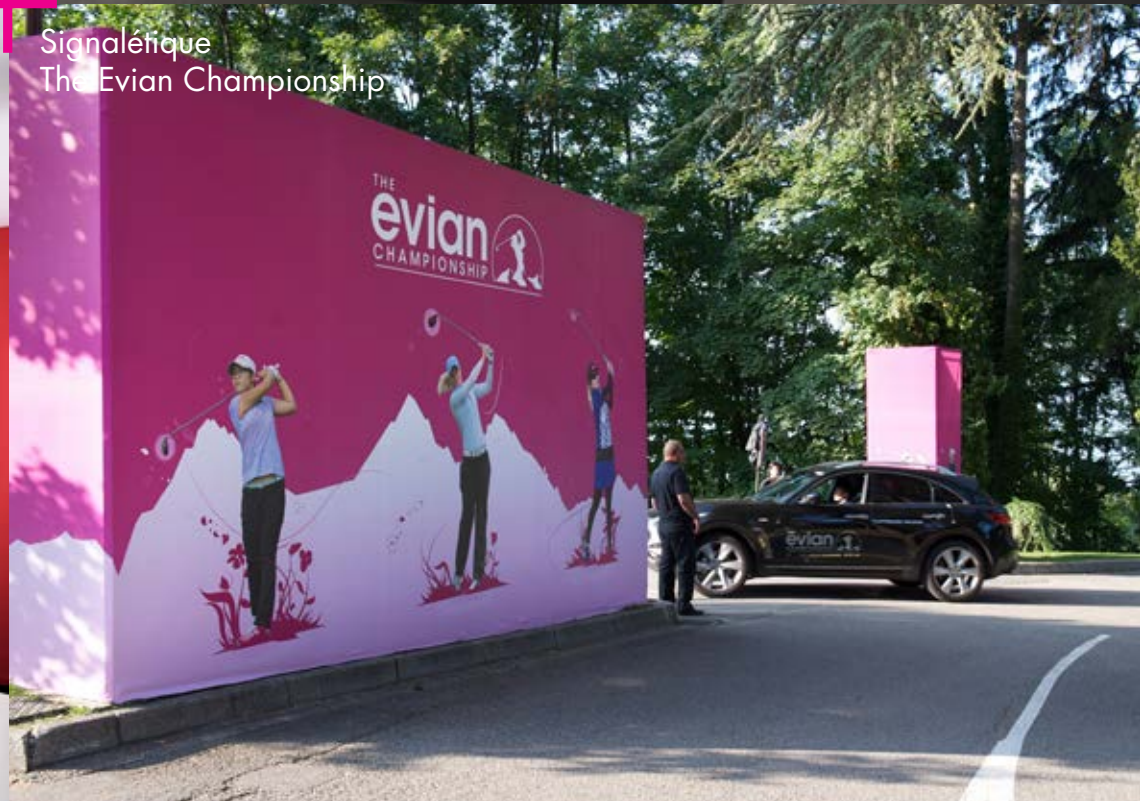
Signalétique The Evian Championship