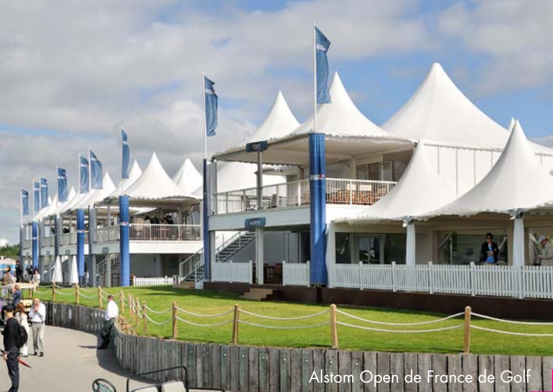
Alstom Open de France de Golf