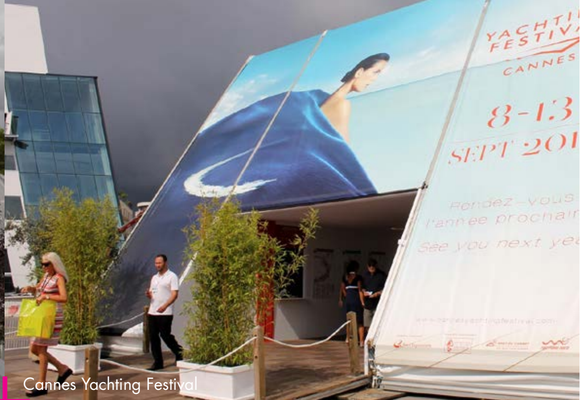
Cannes Yachting Festival