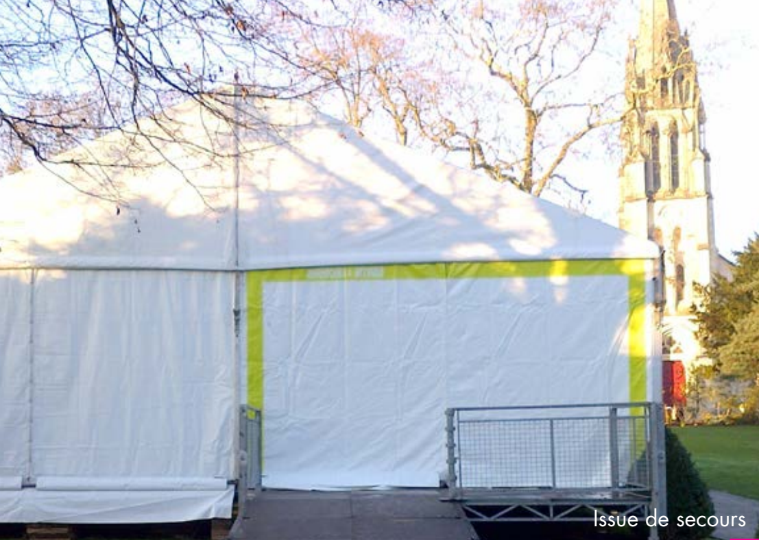
Issue de secours