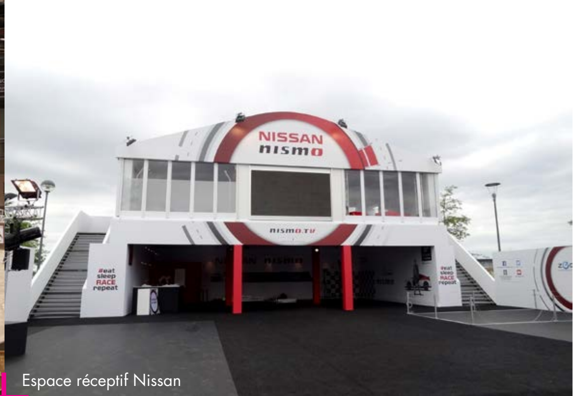
Espace réceptif Nissan