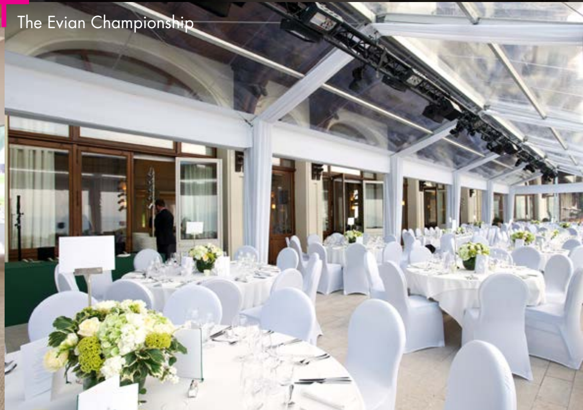
The Evian Championship