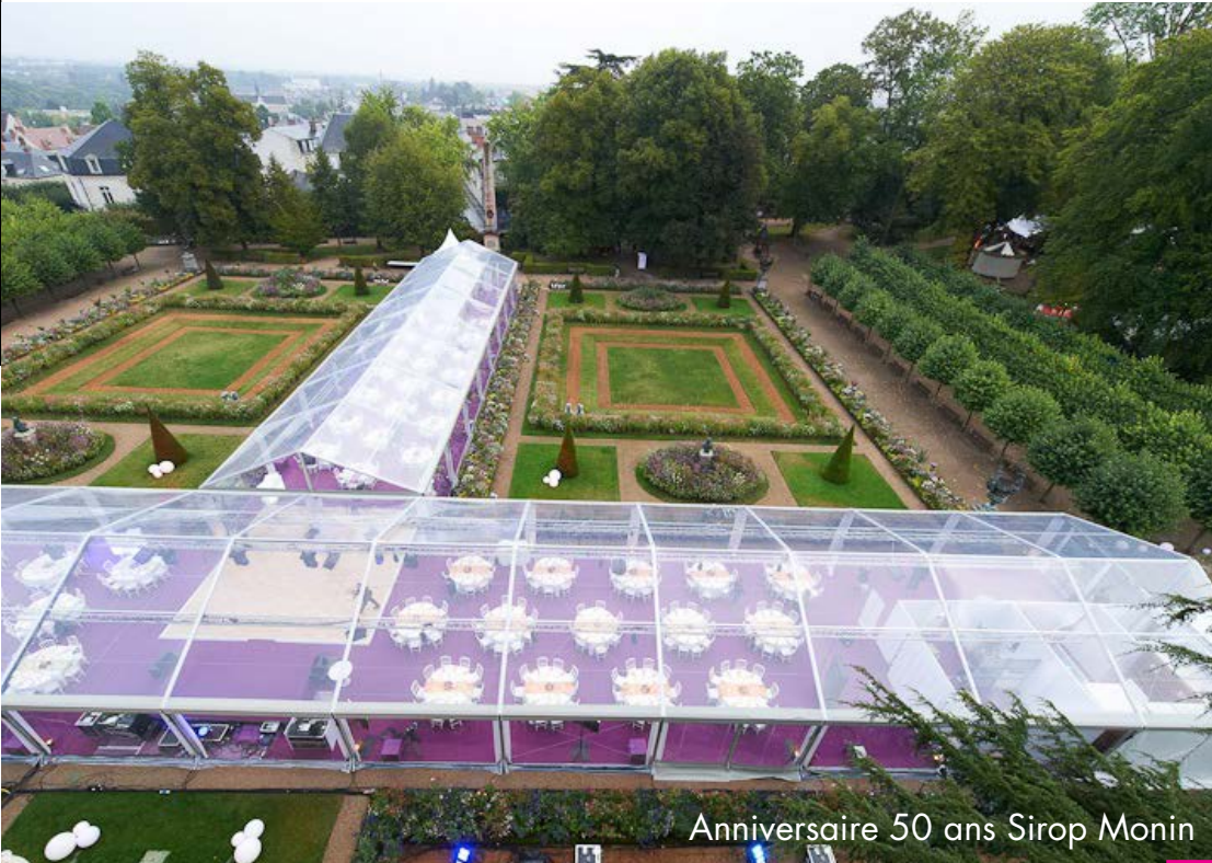
Anniversaire 50 ans Sirop Monin