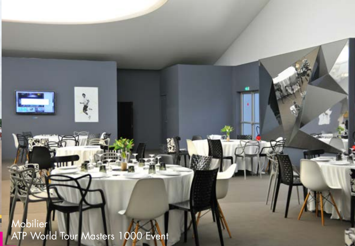
Mobilier ATP World Tour Masters 1000 Event