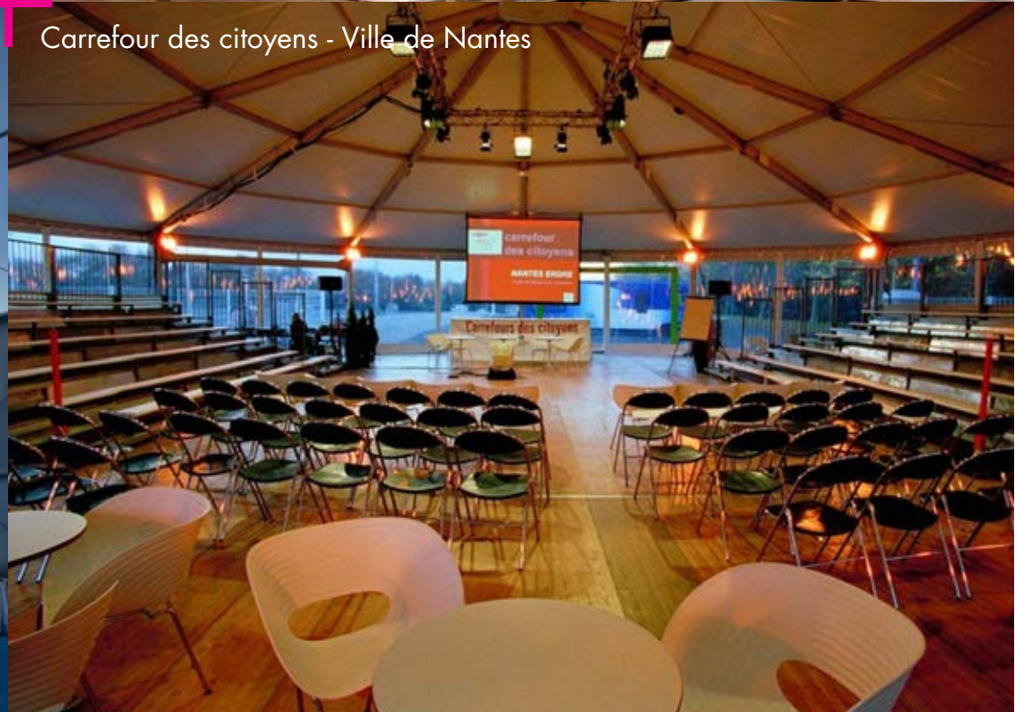
Carrefour des citoyens - Ville de Nantes