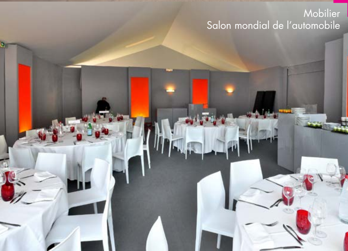
Mobilier Salon mondial de l'automobile