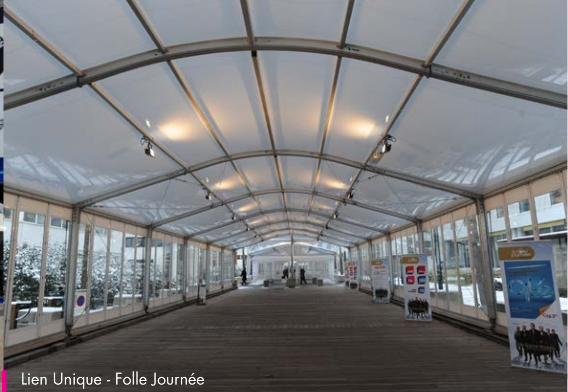
Lien Unique - Folle Journée