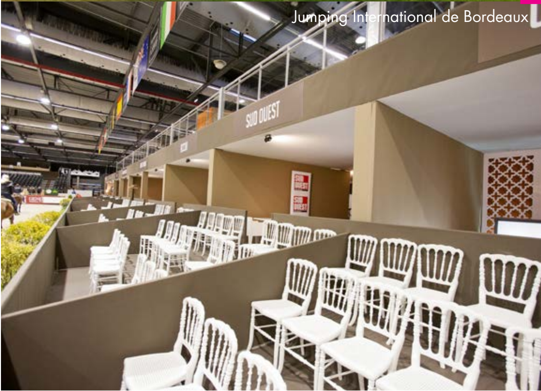
Jumping International de Bordeaux