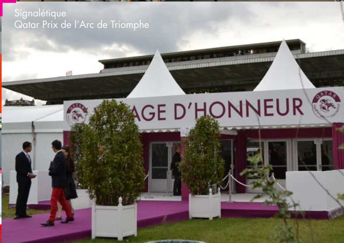
Signalétique Qatar Prix de l'Arc de Triomphe