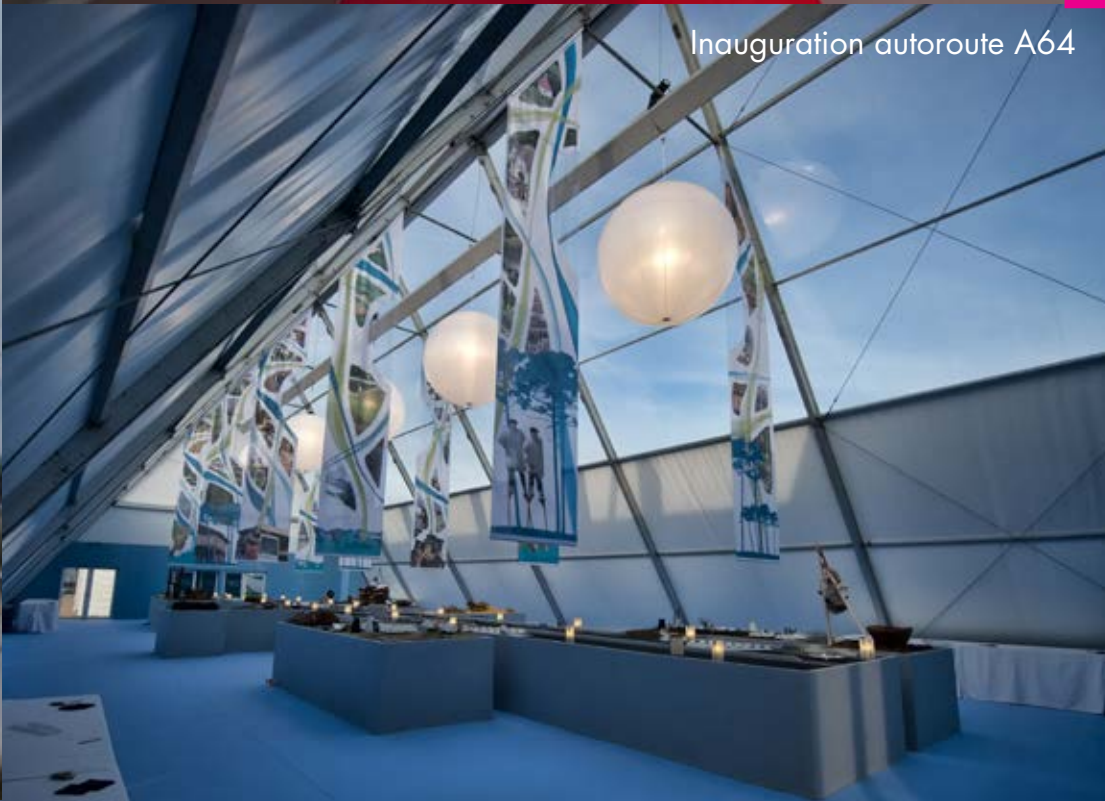
Inauguration autoroute A64