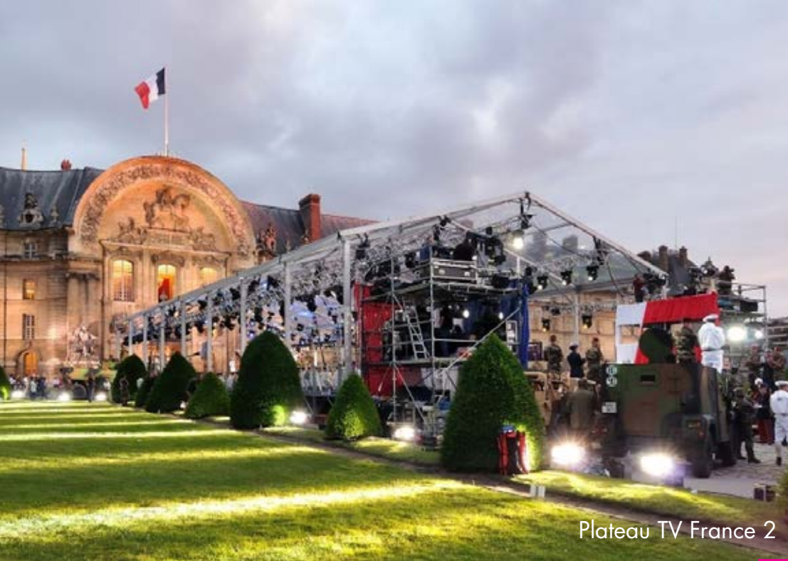
Plateau TV France 2