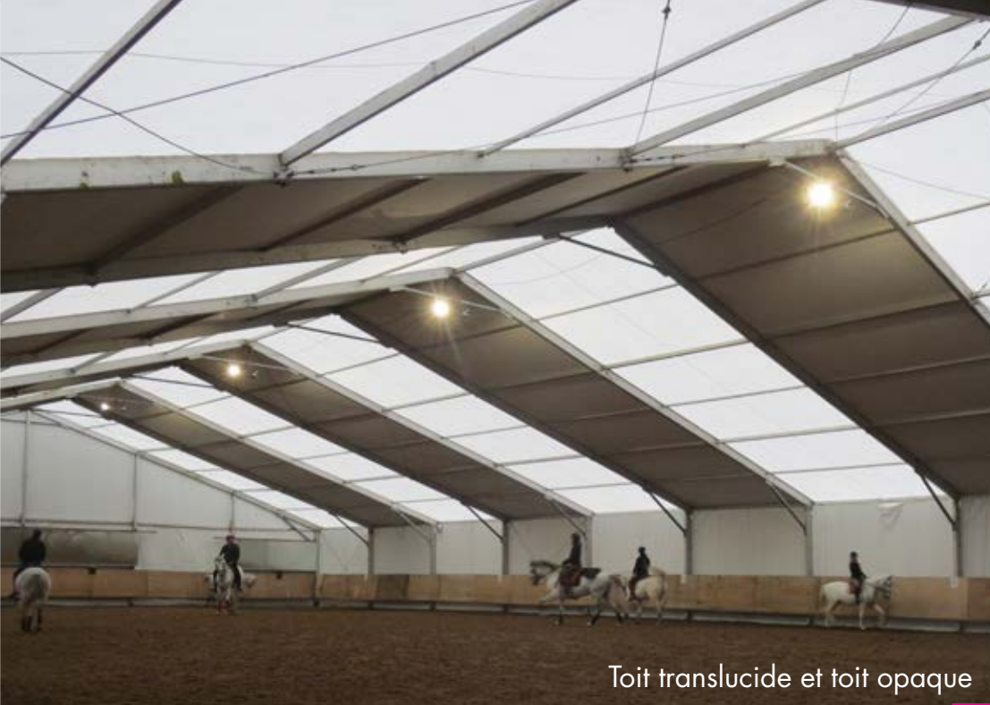
Toit translucide et toit opaque