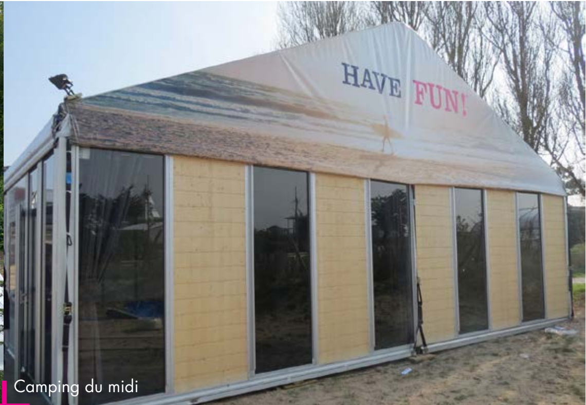
Camping du midi