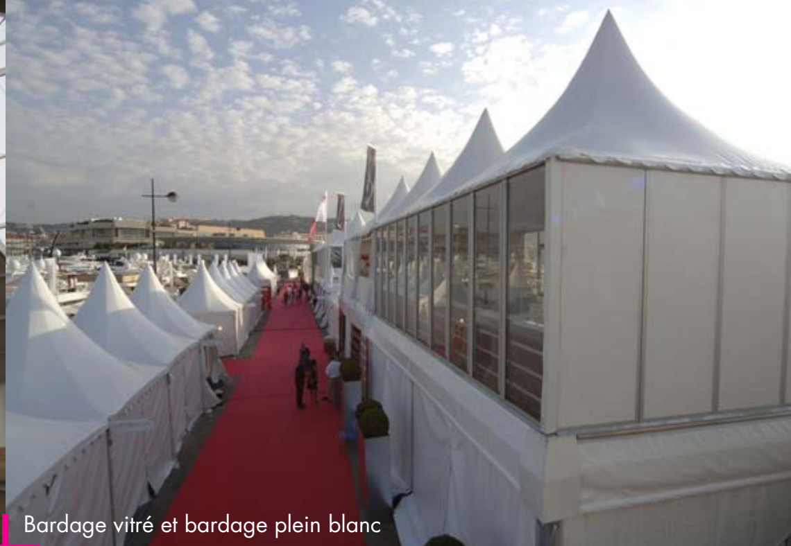
Bardage vitré et bardage plein blanc