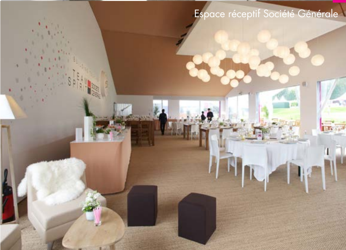
Espace réceptif Société Générale