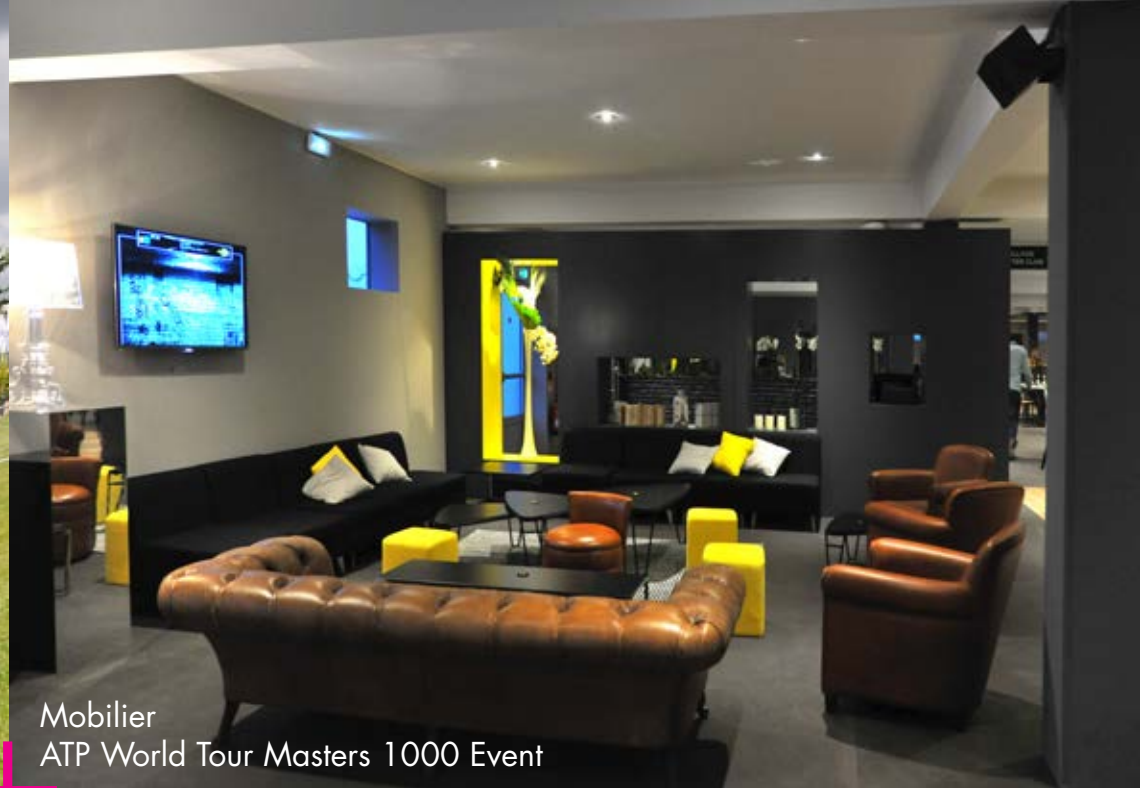
Mobilier ATP World Tour Masters 1000 Event