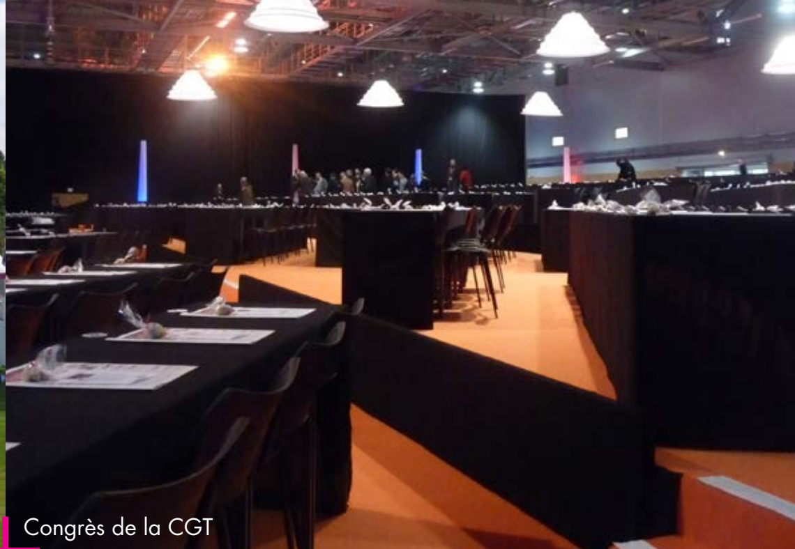
Congrès de la CGT