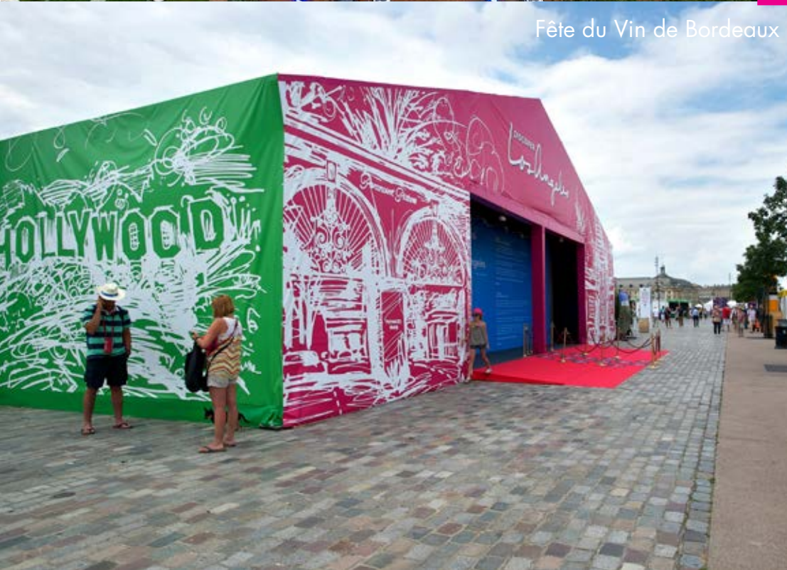
Fête du Vin de Bordeaux