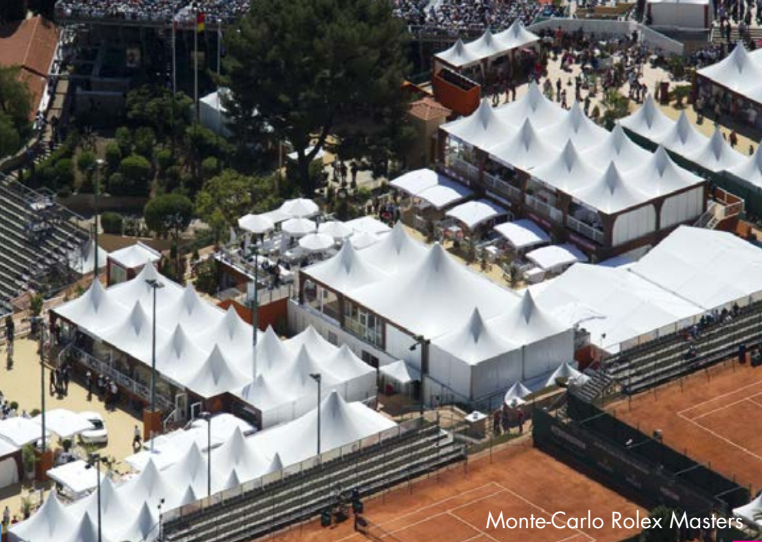
Monte-Carlo Rolex Masters