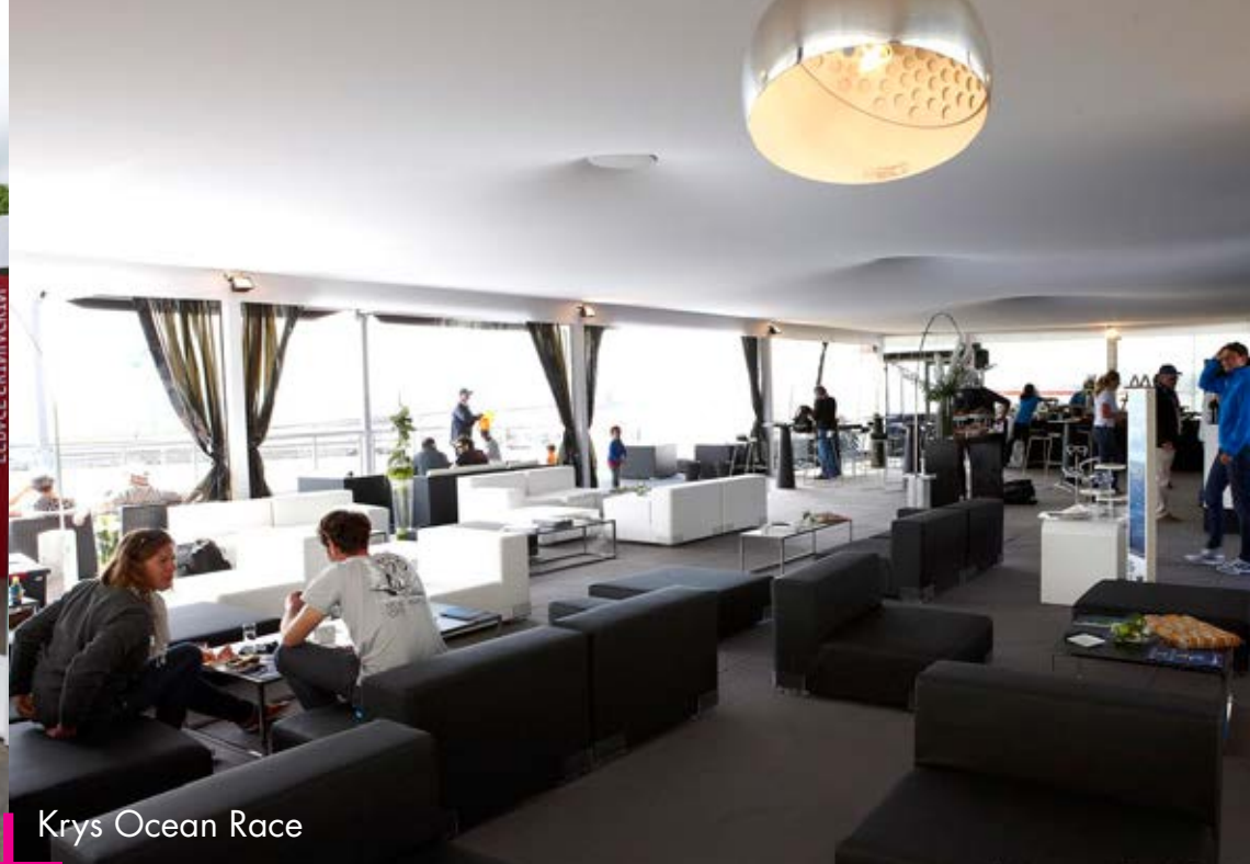
Krys Ocean Race