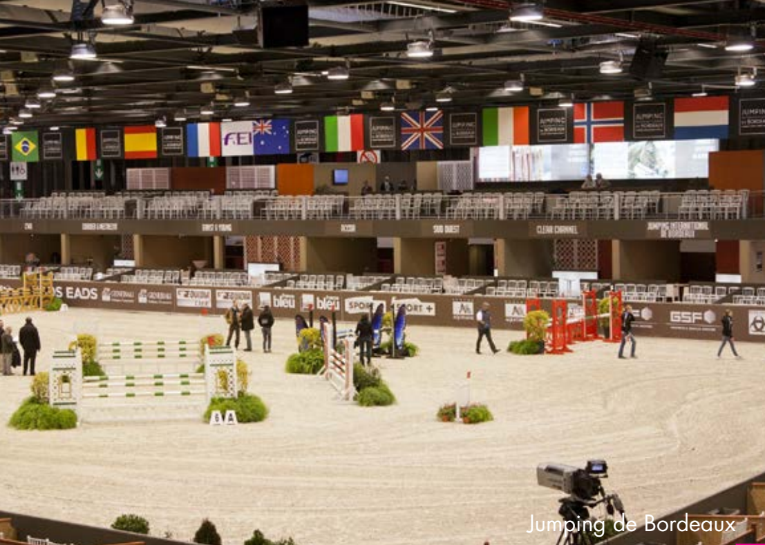
Jumping de Bordeaux