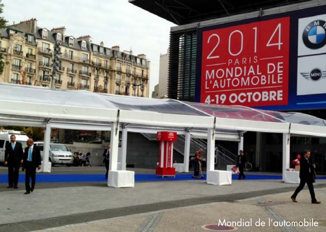
Mondial de l'automobile