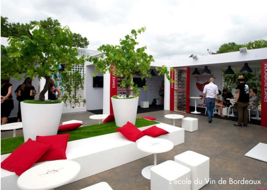
L'ecole du Vin de Bordeaux