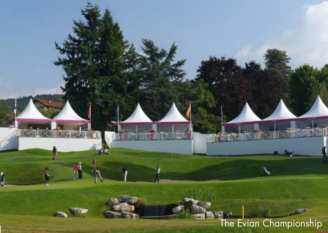
The Evian Championship