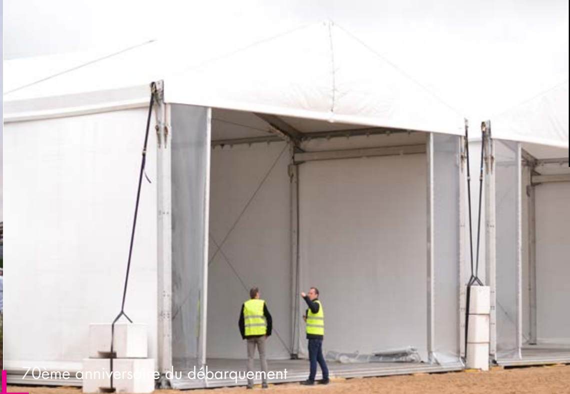
70ème anniversaire du débarquement