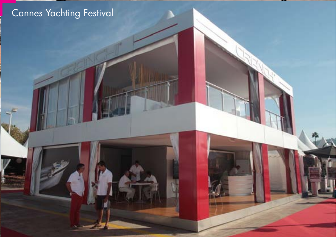
Cannes Yachting Festival