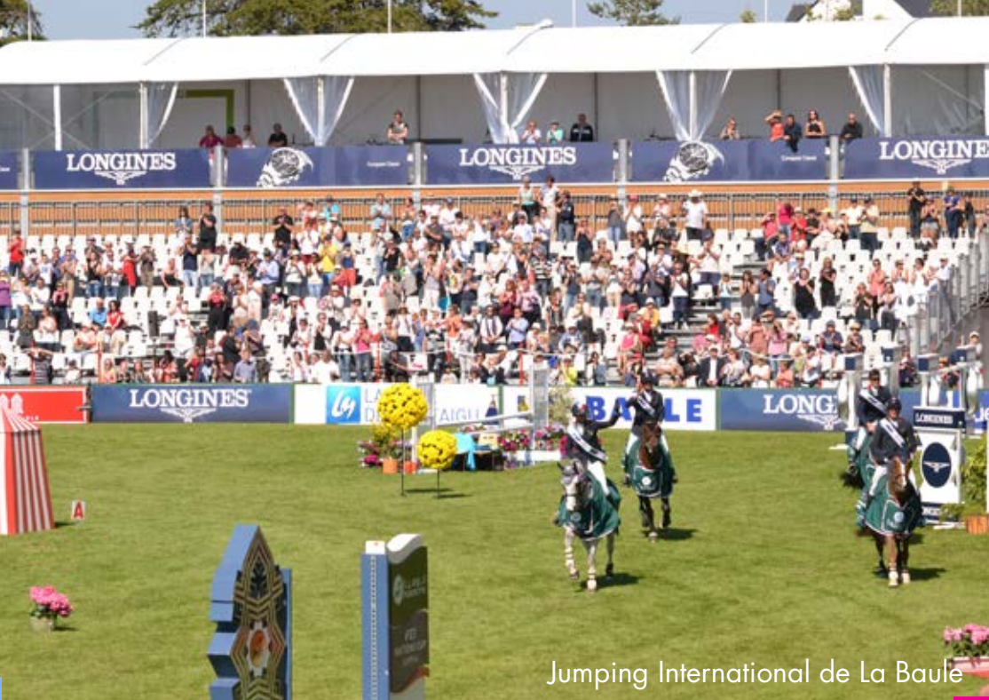
Jumping International de La Baule