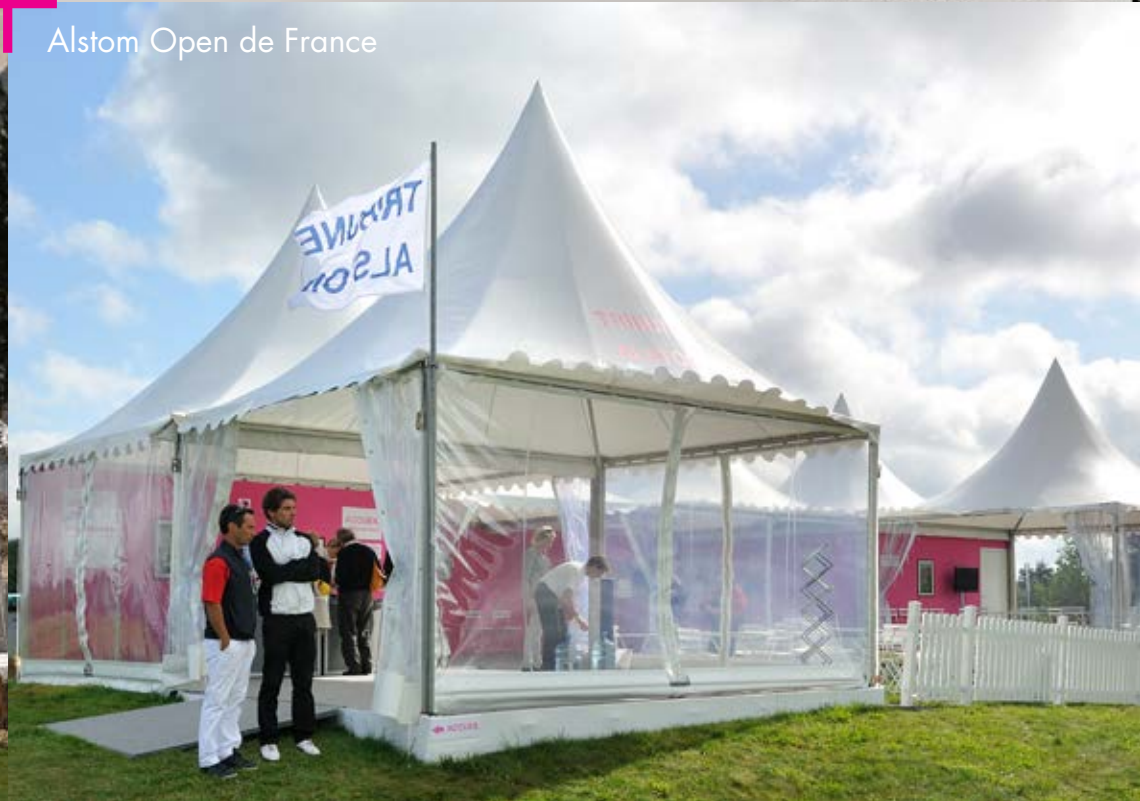
Alstom Open de France