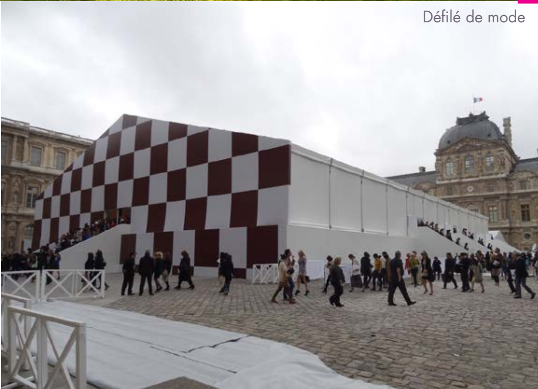
Défilé de mode