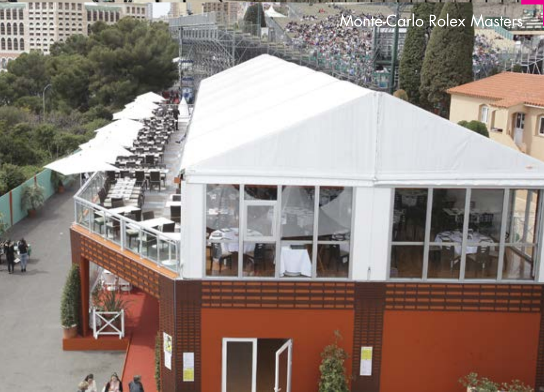
Monte-Carlo Rolex Masters