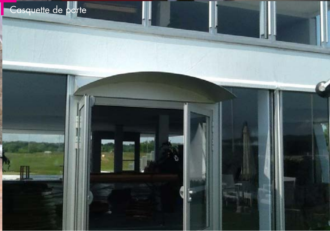
Casquette de porte