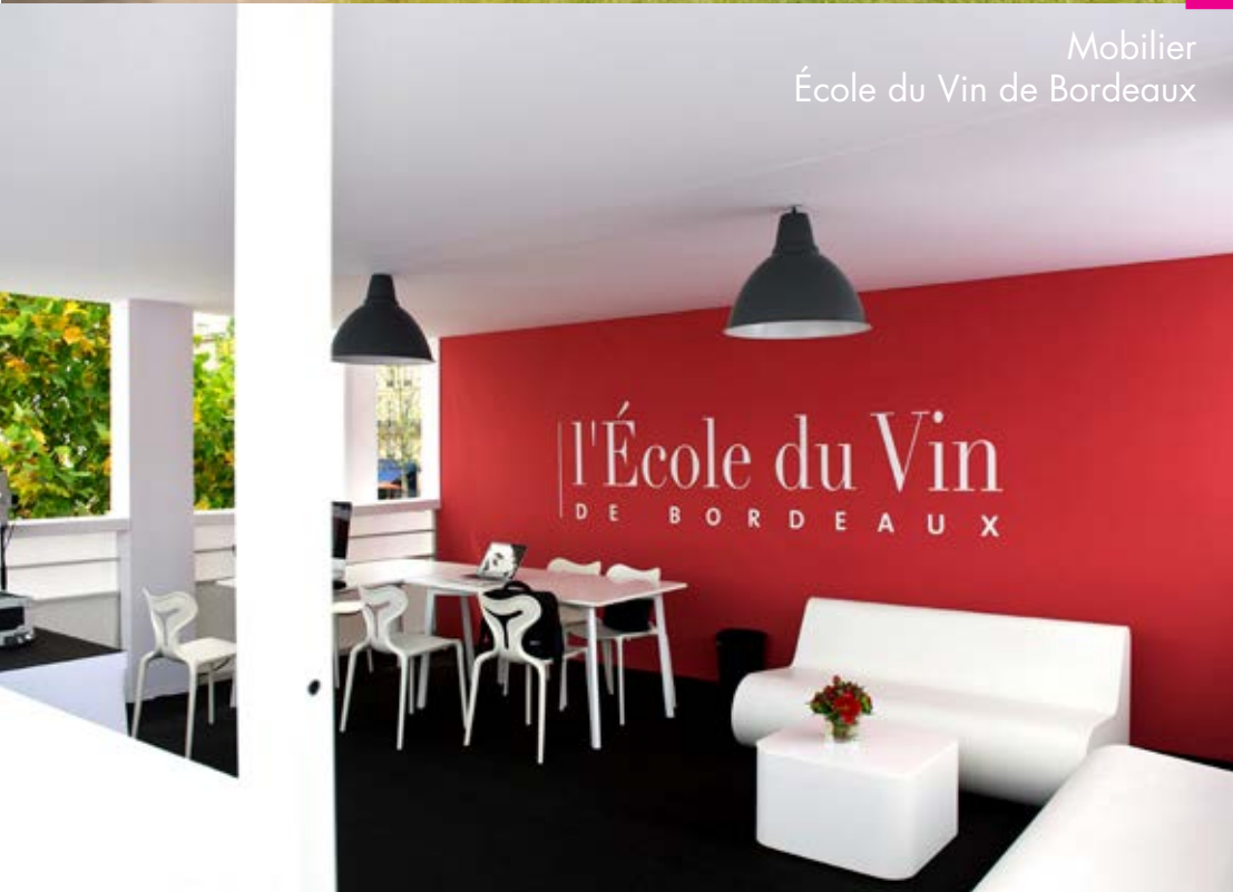
Mobilier École du Vin de Bordeaux