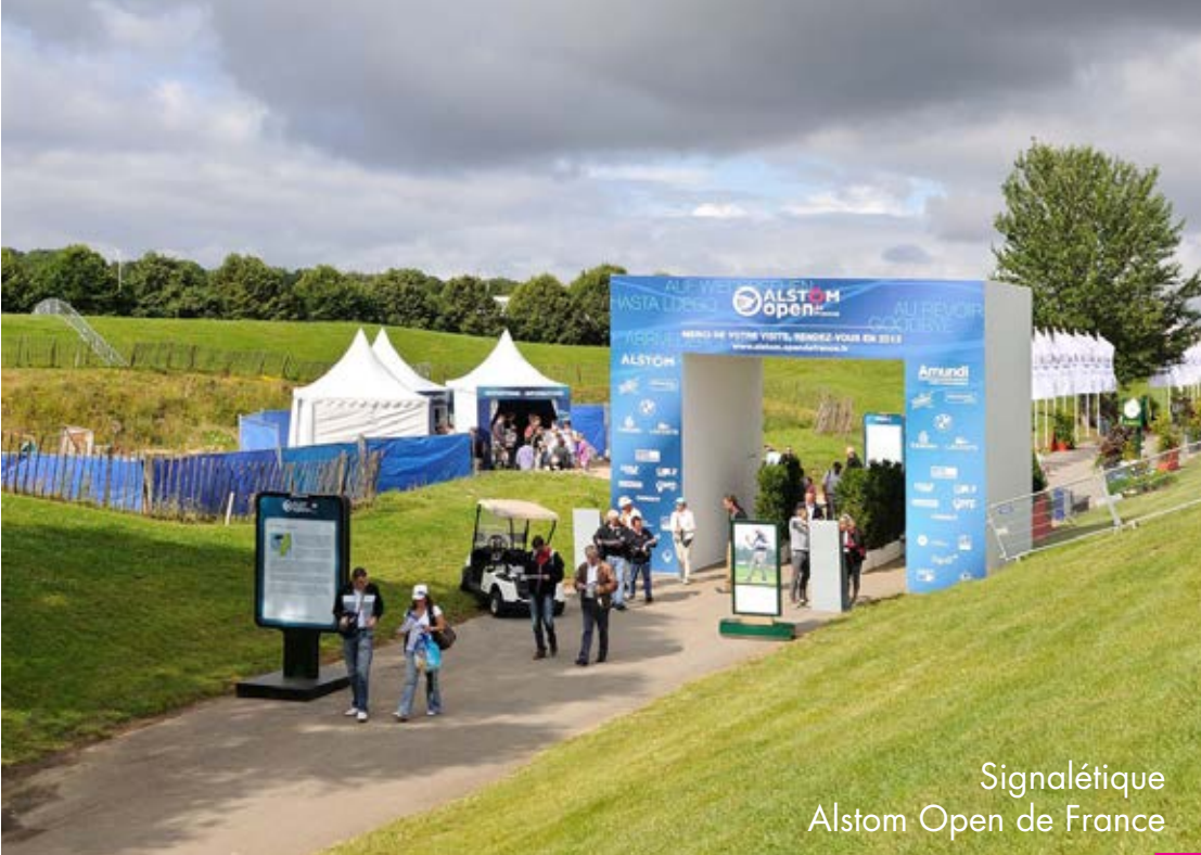
Signalétique Alstom Open de France