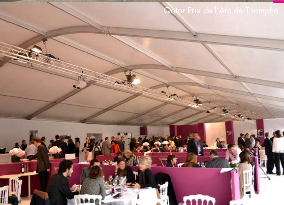
Qatar Prix de l'Arc de Triomphe