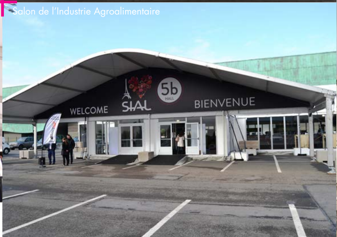
Salon de l'Industrie Agroalimentaire