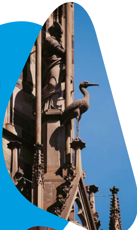
Détail de la Cathédrale de Strasbourg