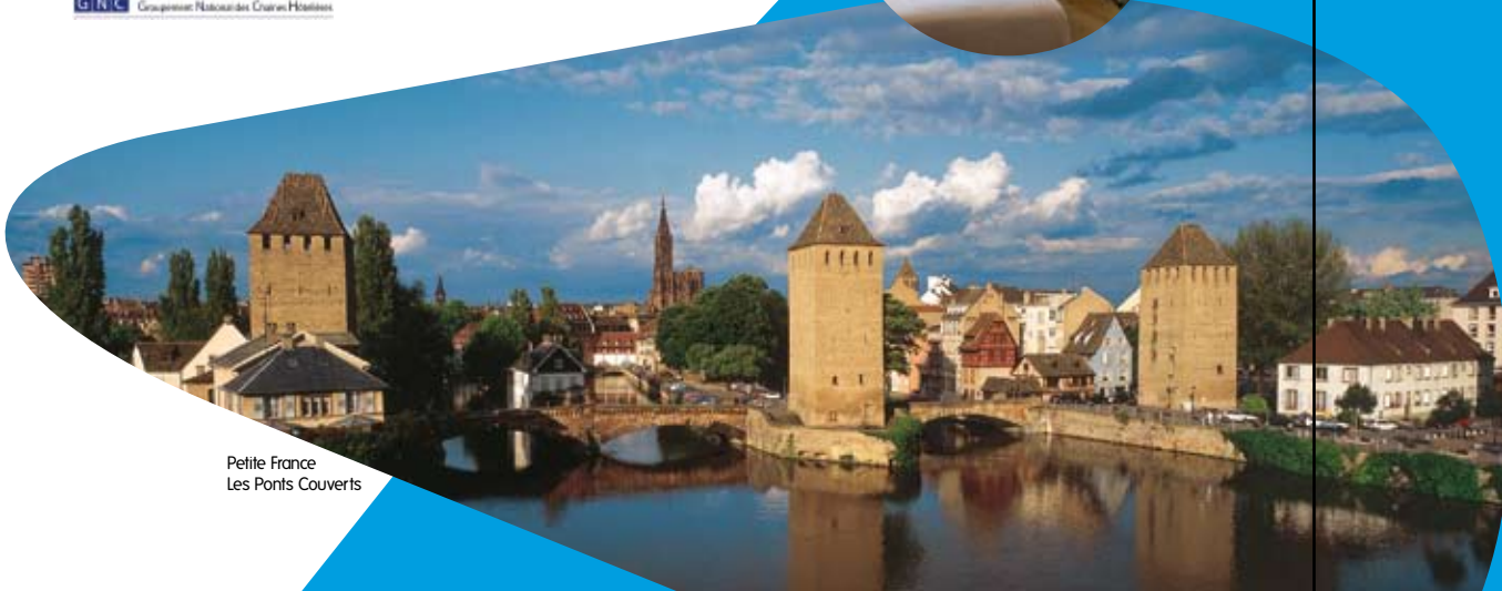
Petite France Les Ponts Couverts