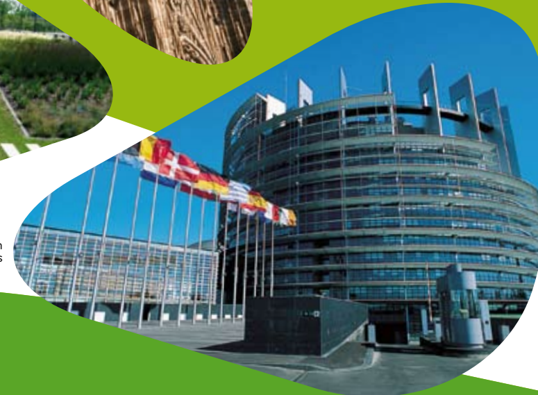
Parlement Européen bâtiment Louise Weiss