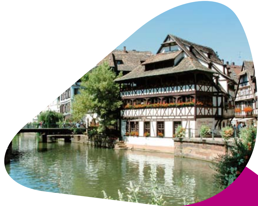
Maison des Tanneurs