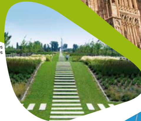
Jardin des Deux Rives