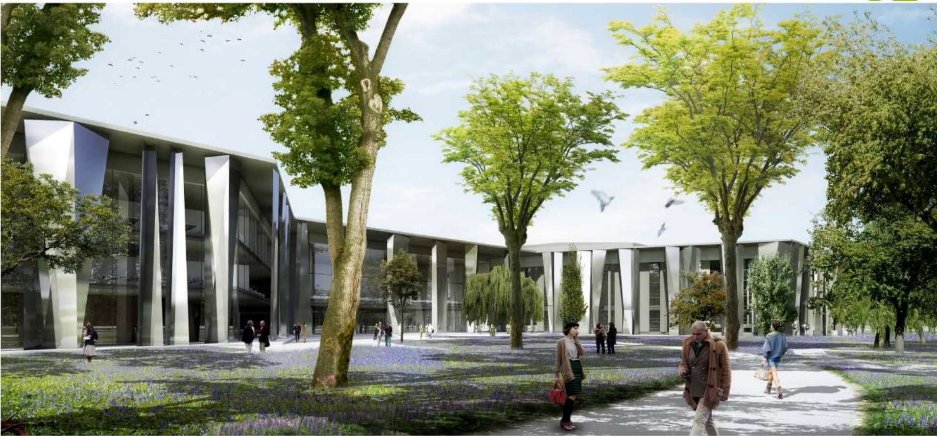
vue sur entrée PMC 2-3