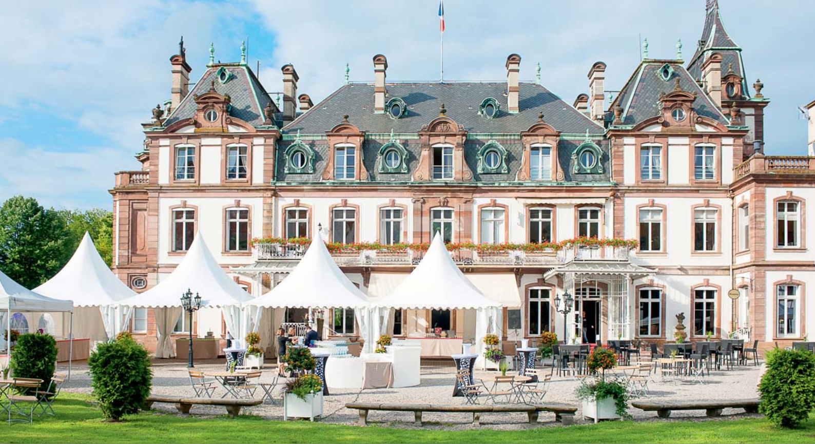
Pourtales - Vue extérieure