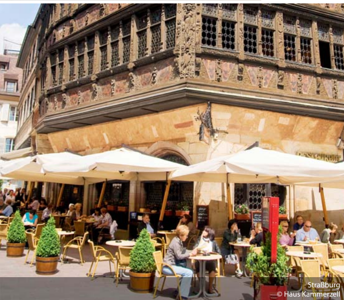
Straßburg © Haus Kammerzell

An drei Tagen informierten sich die Teilnehmer, was Straßburg neben europäischem Flair auch im Tagungs- und Kongressbereich zu bieten hat. Nach der Ankunft im Hotel Sofitel Grande Ile und einer Begrüßung durch Clarisse Kremer vom Convention Bureau in Straßburg