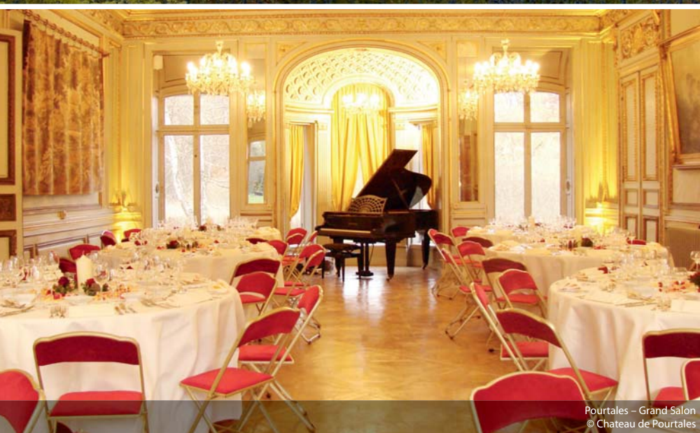
Pourtales – Grand Salon

zen, Tageslicht und Dolmetscherkabinen. Nach Fertigstellung des Bauprojekts gibt es einen weiteren 10.000 Quadratmeter großen Bereich zur variablen Nutzung, wie Ausstellungen, Konferenzen oder zur Bewirtung. 2017 sollen vier zusätzliche Ausstellungshallen mit insgesamt 30.000 Quadratmetern sowie 2.500 Parkplätze hinzukommen. Die Grünanlage, direkt an der Messe, bleibt ebenfalls erhalten. Mit Bauhelmen gesichert, ging es auch direkt auf die Baustelle, wo die Teilnehmer sich vom Baugeschehen selbst ein Bild machen konnten und eine Architektin über den Stand der Dinge berichtete. Die verschiedenen Bereiche des Straßburger Convention & Exhibition Centre werden