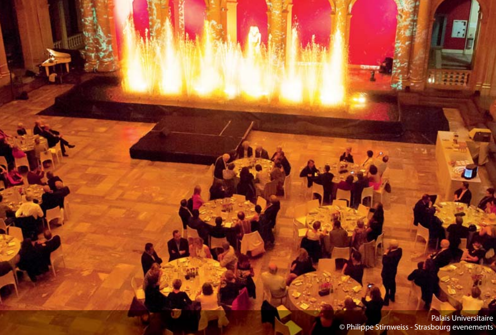
Palais Universitaire