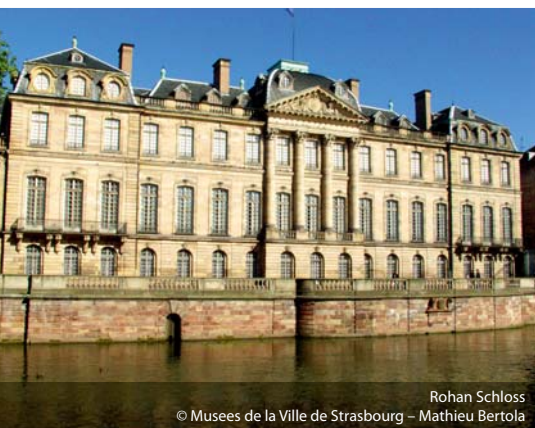
Rohan Schloss