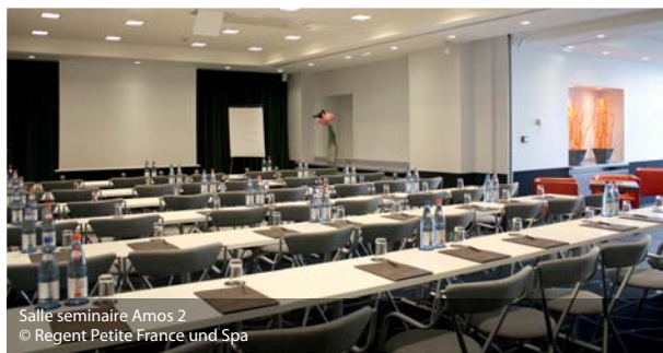
Salle séminaire Amos 2