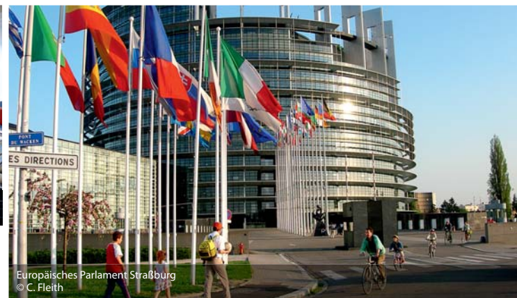
Europäisches Parlament Straßburg