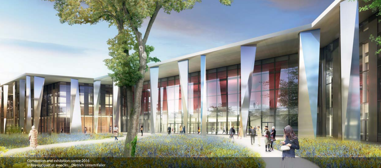
Convention and exhibition centre 2016 © Rey-Lucquet et associés - Dietrich Untertrifaller