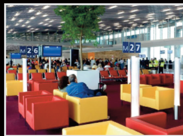
Séminaires & Aéroports