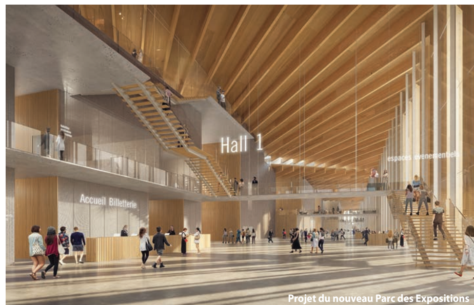
Projet du nouveau Parc des Expositions

Cette configuration, que nous nommons 'Lisières', revisite un archétype ancestral et classique : des repères universels, en lien avec le sol, le ciel et la nature, qui favorisent le bien-être instantané du visiteur... » , a précisé Kengo Kuma.