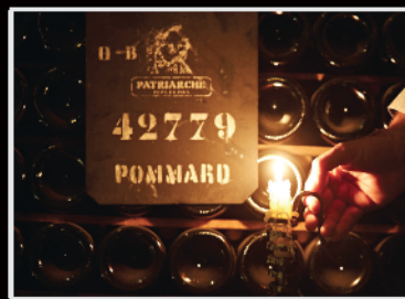
La Bourgogne Franche-Comté