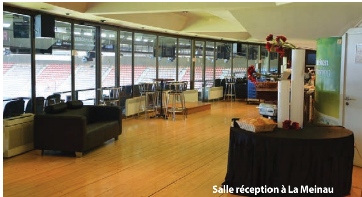
Salle réception à La Meinau

Strasbourg, à côté des infrastructures classiques compte aussi des lieux plus insolites. Citons par exemple avec une capacité totale de 27 000 places, le Stade de la Meinau représente l'un des stades les plus importants en France.