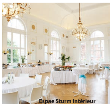
Espace Sturm intérieur

Autre lieu à découvrir le temps d'un séminaire ou d'une journée d'étude : la Villa Quai Sturm . Autrefois, casino à l'allemande, la Villa a été réaménagée en espace réceptif d'exception. Elle compte deux espaces dont l'espace Sturm qui offre un superbe panorama sur le centre-ville, le long des berges de l'Ill. Le lieu peut recevoir au total 300 couverts et a récemment accueilli les Trophées des femmes de l'économie.