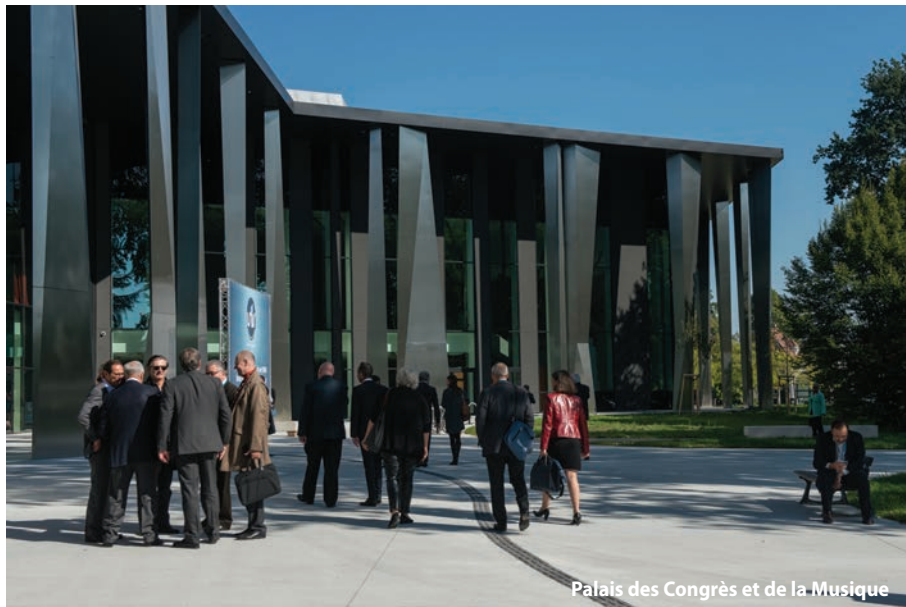
Palais des Congrès et de la Musique

Le futur parc des expositions est un bâtiment emblématique bordé d'un péristyle en bois, agissant en synergie avec le Palais de la Musique et des Congrès contigu et en harmonie avec un contexte à la fois boisé et fluvial, le tout, à deux pas des institutions européennes et du nouveau quartier d'affaires international, Archipel. Un projet qui participera à l'attractivité internationale de la capitale européenne, marquera l'une des principales entrées de la ville et viendra compléter la réorganisation complète du quartier Wacken.