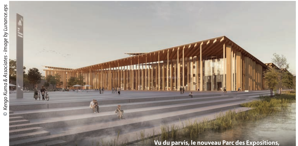
Vu du parvis, le nouveau Parc des Expositions,

Autant d'atouts pour passer à la vitesse supérieure et rayonner sur l'Europe.