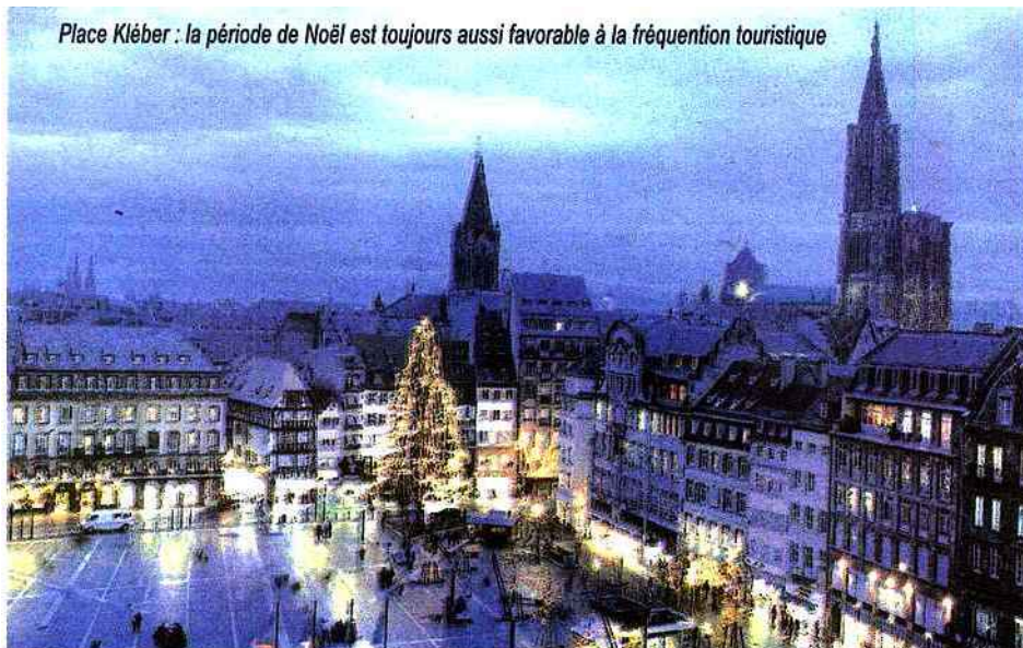
Place Kléber : la période de Noël est toujours aussi favorable à la fréquentation touristique