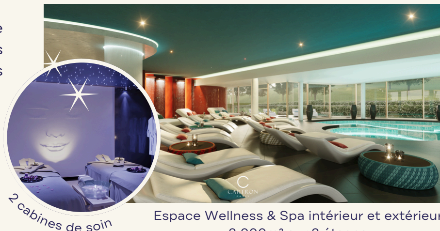
2 cabines de soin

Bassins sensoriels, douches à expérience, saunas, hammam, snow room, grotte de sel, bassins de nage, bain nordique, tisanderie, équipements fitness premium et salle de Pilates.