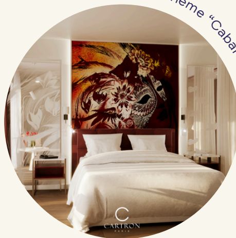
Chambre Thème "Cabaret"

Toutes nos chambres et suites disposent des équipements essentiels à votre confort