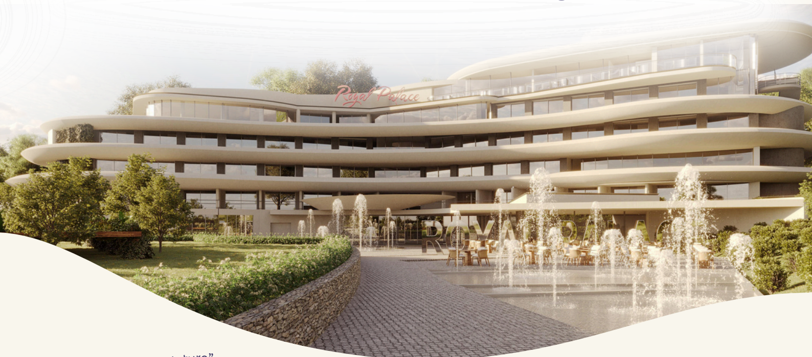
Chambre Thème "Nature"

Une échappée belle au cœur de la campagne alsacienne