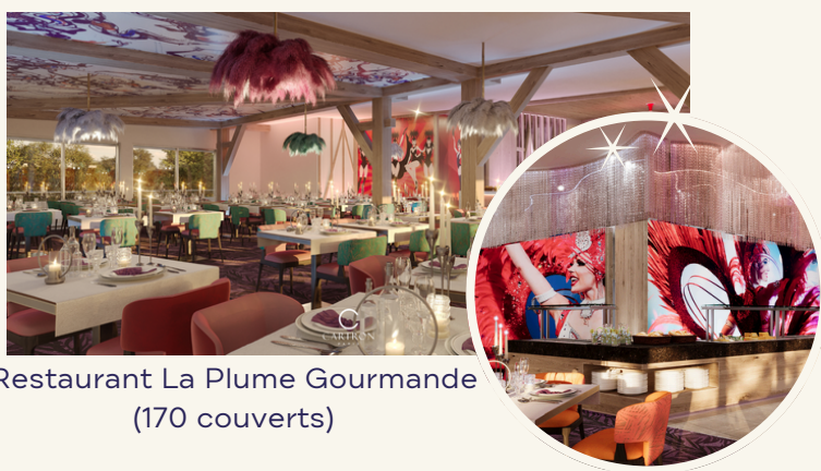
Restaurant La Plume Gourmande (170 couverts)