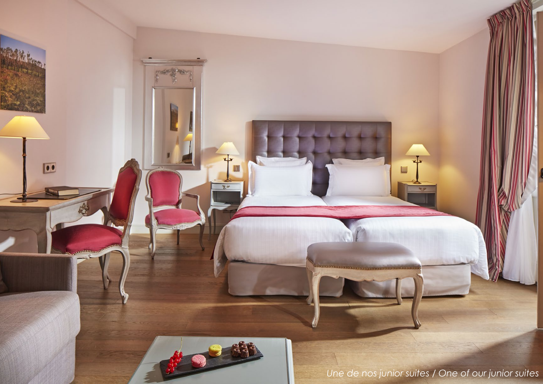
Une de nos junior suites / One of our junior suites