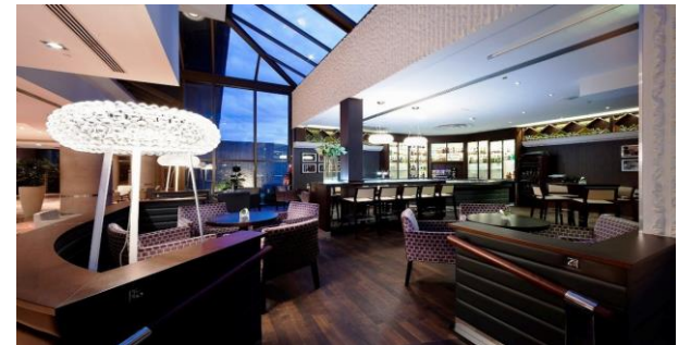
HBar & HBrasserie