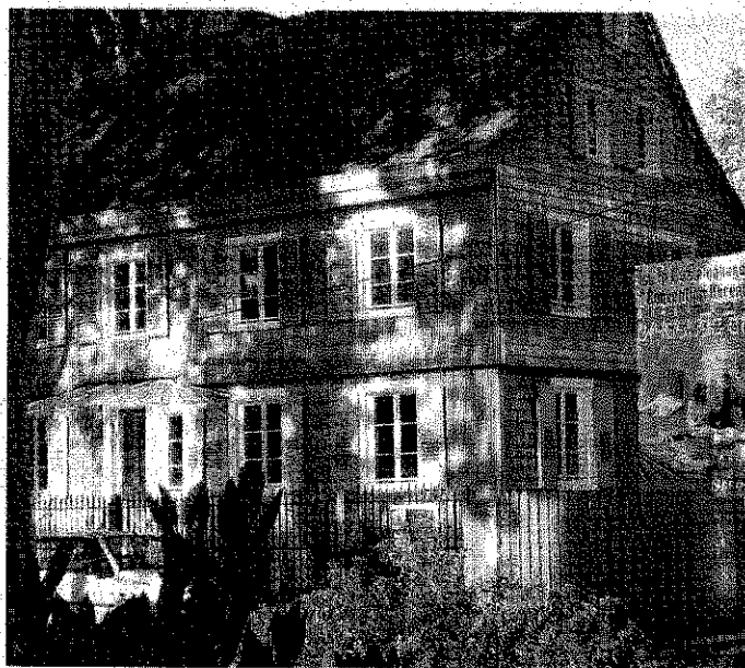
Le «convention bureau» s'est installé dans une petite maison qui jouxte le palais des congrès de Strasbourg.