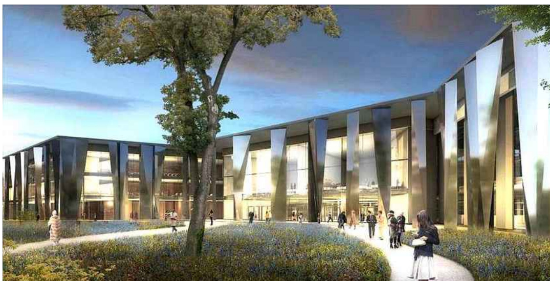
Un péristyle donnera de la cohérence esthétique et une identité aux trois bâtiments qui composeront le PMC rénové et étendu. DOCUMENT CABINET D'ARCHITECTURE RAY LUCQUET ET ASSOCIÉS