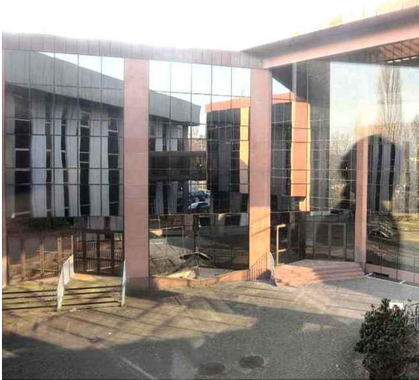
Les deux bâtiments actuels ont aujourd'hui un habillage hétéroclite.