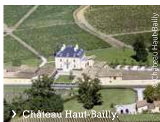
› Château Haut-Bailly.