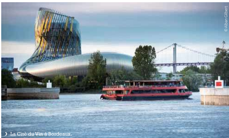
› La Cité du Vin à Bordeaux.