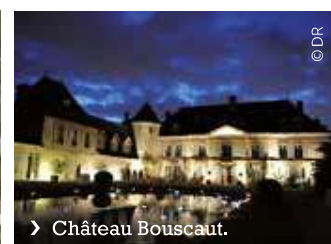
› Château Bouscaut.