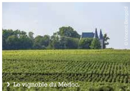
Le vignoble du Médoc.

« J'ai créé Bordovino il y a huit ans, une agence réceptive positionnée sur le vin et l'art de vivre à la française. Nous avons travaillé dès le départ les deux segments MICE et loisirs. Le MICE représente aujourd'hui 40 % de notre chiffre d'affaires