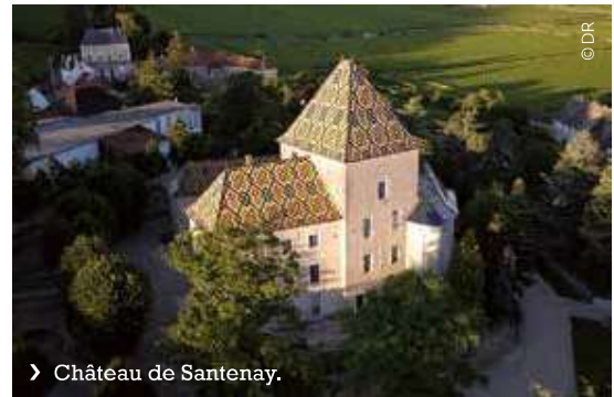
Château de Santenay.

à Bordeaux. Nous travaillons avec une trentaine de châteaux, dont Château Côte de Baleau à Saint-Émilion. Notre catalogue d'activités récréatives est étoffé, d'une heure à une journée, avec des balades à cheval ou à vélo, des rallyes, challenges, chasses au trésor et ateliers dégustation, pour des comités de direction comme des groupes de 350 personnes. Nous avons décliné notre offre dans la Loire, en Champagne, et depuis peu en Bourgogne et en Provence, deux régions sur lesquelles nous ne travaillons pas encore le MICE. C'est pour réunir nos différentes destinations que nous avons créé la marque ombrelle « À la française », laquelle va progressivement se substituer à Bordovino à Bordeaux. La Champagne fait rêver et se développe fortement. Ses atouts sont nombreux, notamment ses belles infrastructures et sa proximité avec Paris. À l'instar de Bordeaux, la Champagne est une marque. Elle a su se positionner sur l'art de vivre et l'expérience. En revanche, la Bourgogne reste très associée au vin. Ses vignobles sont de moindre taille et ne peuvent accueillir des groupes importants. On est encore là-bas au niveau du Bordeaux que j'ai connu il y a dix ans. »