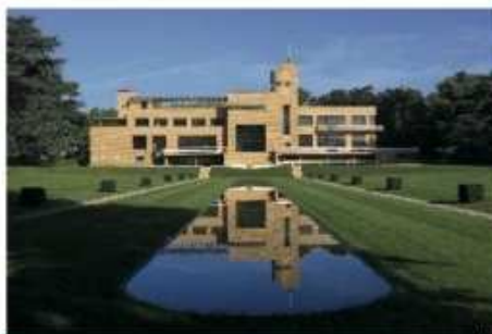
EURLILLE / CENTRE DES MONUMENTS NATIONAUX

sans faille. Dès les années 2010, la métropole a créé le Lille Convention Bureau pour convaincre les entreprises de venir s'y échapper. Avec succès : de 12 000 journées congressistes en 2012, elle est passée à près de 150 000 l'an passé ! Pour aller encore plus loin, la structure vient d'intégrer la nouvelle agence d'attractivité Hello Lille, fédérant les acteurs économiques et touristiques. Autour de la gare, le quartier Euralille est le point de chute des entreprises, avec le centre de congrès et le Zénith réunis sous le même toit, géré par Lille Grand Palais, mais aussi une ribambelle d'hôtels, à l'instar du resort Barrière. Dans quelques semaines, Mama Shelter y plantera son drapeau. Deux autres enseignes « trendy » – Moxy et Okko – sont attendues en 2020, symboles d'une métropole bien dans son temps... Dans cette ville au patrimoine flamboyant où l'art flamand jaillit à chaque coin de rue, les bonnes adresses ne manquent pas pour occuper un groupe après le travail. L'agence Génération Voyages organise des