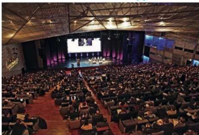
Avec quatre auditoriums dont l'auditorium Vauban (1486 places), Lille Grand Palais accueille les plus grandes manifestations européennes.