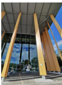
L'entrée du Parc des Expositions

Selon Christophe Caillaud-Joos, le bois permet une ventilation et isolation naturelle. Mais ce n'est pas l'unique mesure prise pour faire du nouveau Parc des Expositions un modèle d'éco-structure .