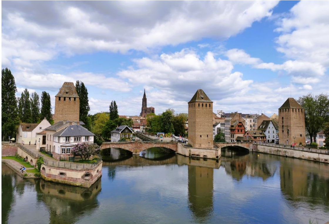
Strasbourg redéfinit son image de destination affaires sur des critères environnementaux

C'est plus qu'une très belle construction esthétique. Le nouveau Parc des Expositions de Strasbourg , inauguré début septembre, assoit l'ambition de Strasbourg . Carrefour européen de premier plan, l' Eurométropole entre France et Allemagne souhaite aujourd'hui devenir un modèle pour le développement durable urbain.