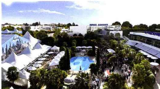
Le West-Events Westotel