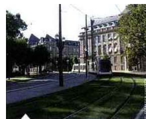
Strasbourg est souvent choisie pour ses transports

cyclables le plus étendu de France, adossé en prime à un système de location Vélhop, sans oublier des lignes de tram multiples et 21 stations d'auto-partage. Et pour inciter les participants aux événements à prendre les transports en commun, « nous avons mis en place MyTicket, une journée offerte pour un ticket trois journées », confie Mireille Dartus, directrice du Strasbourg Convention Bureau .