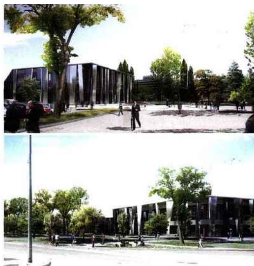
En 2013, Strasbourg disposera d'un palais des expositions et d'un palais des congrès HQE